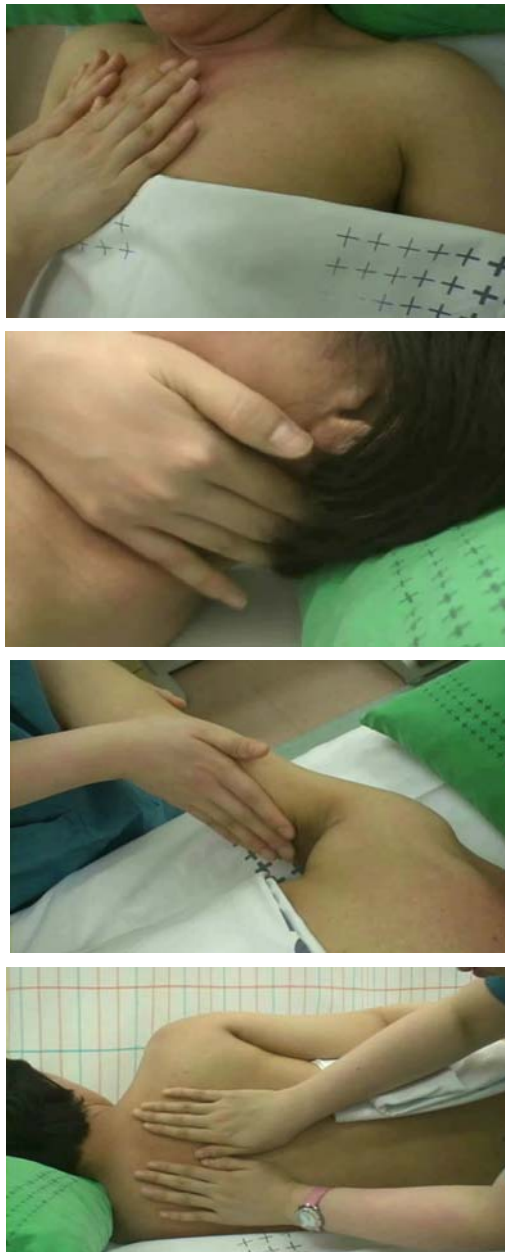
그림 1. 림프마사지

었다(그림 1). 환자는 치료기간 중 물리치료, 압박붕대 등 림프부종 관리를 위한 다른 치료를 받지 않았다.